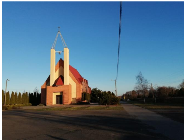
Kościół w Garkach