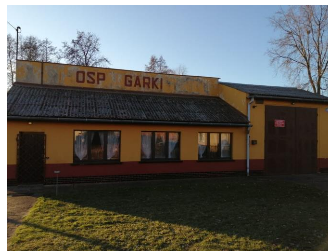
Remiza OSP Garki