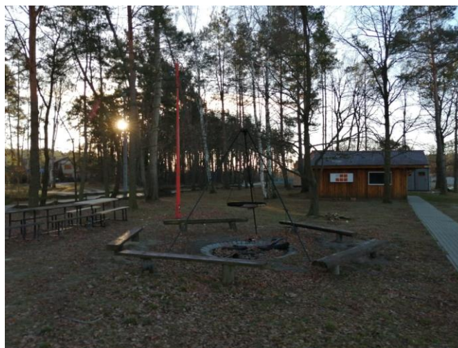
Teren rekreacyjny w Garkach