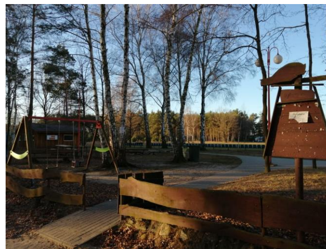
Teren rekreacyjny w Garkach