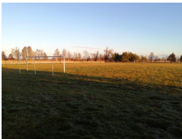
Boisko piłkarskie w Hucie