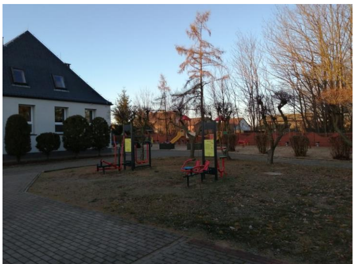
Siłownia zewnętrzna w Hucie