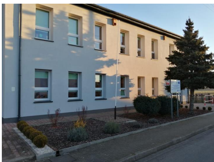
Szkola w Hucie